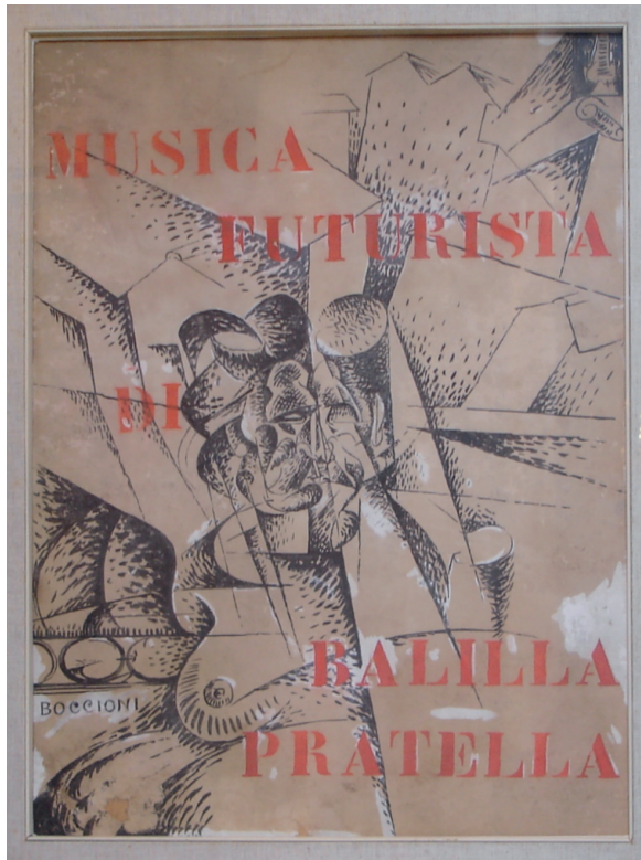
Umberto Boccioni, "Musica Futurista di Balilla Pratella", 1912, collezione privata, quadro per la copertina dello spartito omonimo

Per quanto concerne i commenti ai programmi si leggano rispettivamente le note al concerto del 5 giugno per la prima parte e quelle al concerto del 4 giugno per la seconda, che comprende anche informazioni sulla chitarra scelta per il concerto.