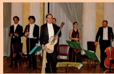
'800 Musica Ensemble